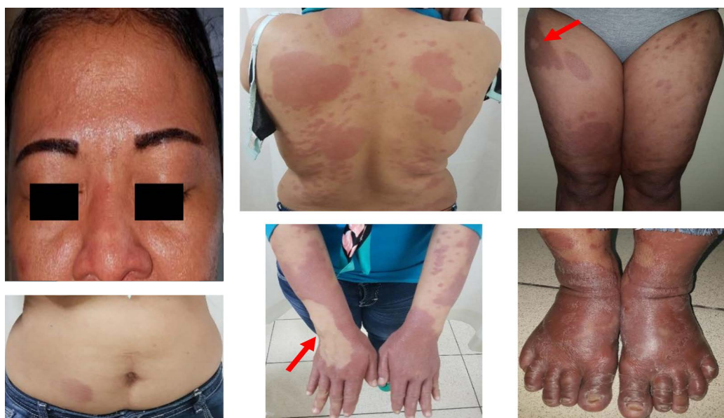
Gambar 1. Manifestasi klinis berupa plak eritematosa generalisata dengan lesi punched-out di lengan kanan dan paha kanan (ditunjukkan dengan tanda panah).

Pasien kemudian dirujuk ke divisi Alergi Imunologi dan Infeksi Tropik Poliklinik Kulit dan Kelamin RS dr. Cipto Mangunkusumo. Pada pemeriksaan fisik didapatkan status generalis dalam batas normal dan status dermatologikus didapatkan plak tipis eritematosa, multipel, berukuran plak, tersebar diskret-konfluens, beberapa tampak lesi punched-out , hipoestesi pada regio wajah, punggung, perut, kedua lengan, dan kedua tungkai. (Gambar 1.) Terdapat pembesaran kedua saraf ulnaris dan kedua saraf tibialis posterior dengan konsistensi kenyal. Pada pemeriksaan basil tahan asam didapatkan indeks bakteri (IB): 0/6 dan indeks morfologi (IM): 0%. Diagnosis pasien adalah kusta tipe mid-borderline dan riwayat erupsi alergi obat tipe sindrom hipersensitivitas obat yang kemungkinan disebabkan MDT MB. Pasien mendapat obat metilprednisolon 2x16 mg, tapering off selama 6 minggu, dan direncanakan uji tempel 6 minggu setelah bebas lesi SHO. Tata laksana kusta pada pasien menunggu hasil uji tempel.